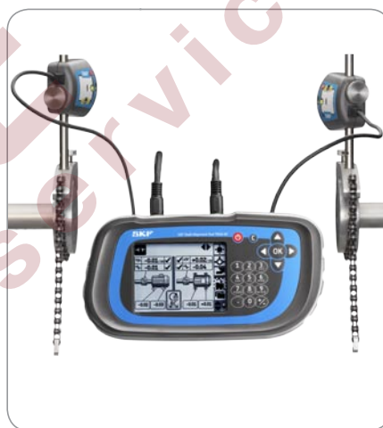
Простое сохранение результатов